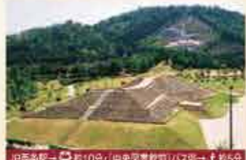
15 三ツ城古墳 5世紀前半築造の県内最大の前方後円墳。副葬品などが東隣の図書館に展示されています。