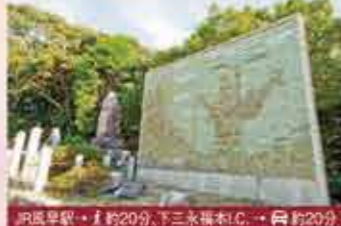
19 祝詞山八幡神社 安芸津エリアの神社。万葉の碑とともに瀬戸内を望む景色も楽しめます。