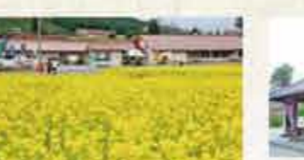
22 福富物産しゃくなげ館 福富町下竹仁470-1 ☎082-435-3533 ☎9:00～18:00(11月～2月は17:00まで) ④火曜、年末年始