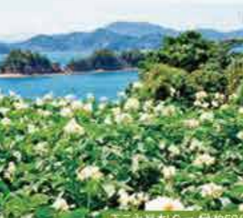
2 赤崎海岸 初夏にはじゃがいも畑の白い花と青い海の美しいコントラストが楽しめます。