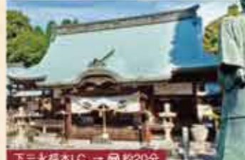
17 神山八幡神社 酒造など安芸津の産業を見守る神社。社内には広島酒の生みの親・三浦仙三郎像が。