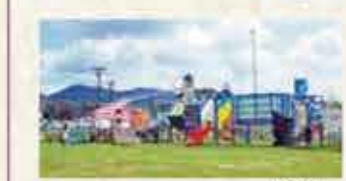
20 道の駅 湖群の里 福富 福富町久芳1506 ☎082-435-2110 ☎9:30～18:00(店舗、季節等により異なる) ④水曜、年末年始 ※大型遊具やデイキャンプ場もあり