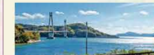
24 安芸津の海岸線 ゆるやかなカーブが続く海岸線。道路沿いにはドライブインや牡蠣の直売所、地元野菜の販売所などが並んでいます。

となりの農家 [高屋店] 高屋町村原1264-1 ☎082-439-1147 [黒瀬店] 黒瀬町南方829-1 ☎0823-83-2700 ☎9:00～17:00 ④お問い合わせください。 JA芸南農産物直売所「ふれあい市安芸津店」 安芸津町風早647-8 ☎0846-46-1166 ☎8:00～15:00 ④年始(1/1～1/4)、8/15