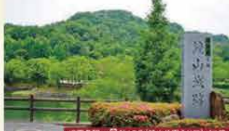
12 鏡山城跡 西条盆地のほぼ中央にある戦国時代の城跡。麓は公園が整備され、桜の名所でもあります。