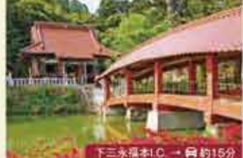
18 福成寺 奈良時代から伝わる寺。本堂内の厨子と須弥壇は国の重要文化財に指定されています。