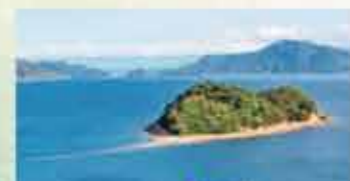
25 大芝島・小芝島 「大芝島」からは、ハート型に見える「小芝島」を望めます。