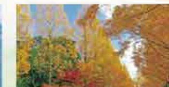
26 鏡山公園 鏡山城麓にあり、四季折々の木々の色が楽しめます。市民の憩いの空間になっています。