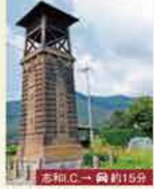
11 時報塔 アールデコ風の装飾が美しい大正時代の建物。現在はサイレンが時を知らせています。