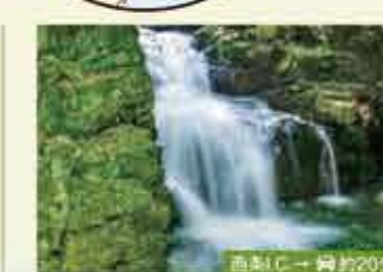
1 わにぶちの滝 恋をした大蛇の伝説が伝えられる滝。落差6mながら優美な景観に心癒されます。