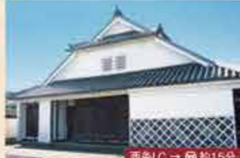
16 旧石井家住宅 旧西国街道沿いにあった江戸時代の町家。市の重要文化財です。