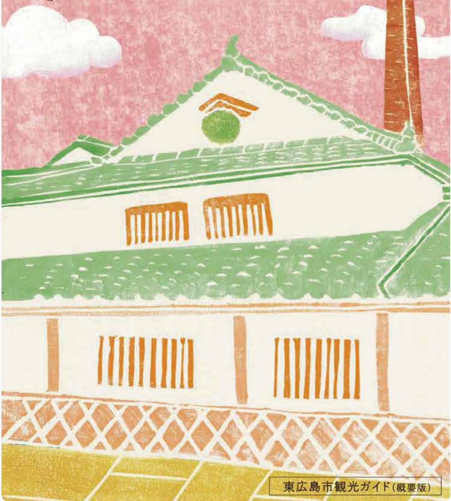
東広島市観光ガイド(概要版)