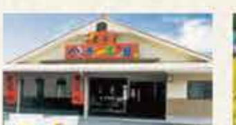
21 とよさか四季菜館 豊栄町御治屋841-2 ☎082-432-4520 ☎営業所/7:30～17:00(土日祝日) 食堂/10:00～14:00(※月曜)