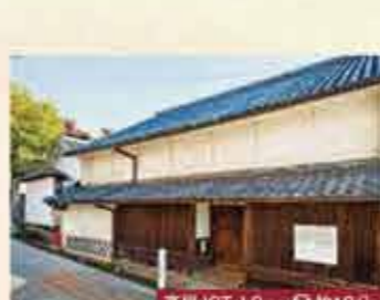
13 白市のまち並みと旧町家 戦国～江戸期にかけて栄えた地域。当時の繁栄を偲ぶる日本家屋が並びます。